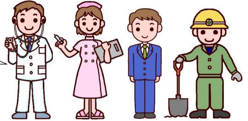
被災地外からの支援者